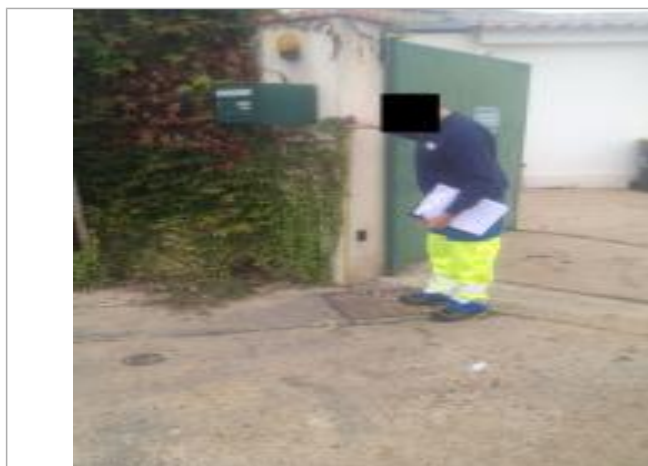
Rive gauche entre le marégraphe et le pont à Elbeuf.

SOURCE DE REPÉRAGE : VISITE TERRAIN DREAL NORMANDIE - 05/06/2016