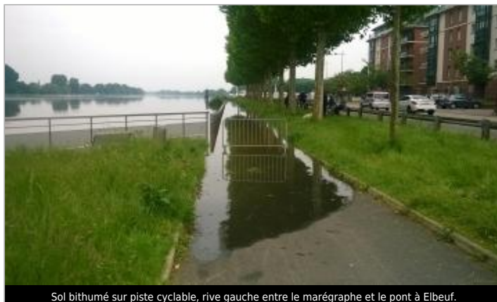
Sol bithumé sur piste cyclable, rive gauche entre le marégraphe et le pont à Elbeuf.