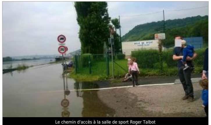
Le chemin d'accès à la salle de sport Roger Talbot

Coordonnées WGS84 : X: 1.12062700 / Y: 49.40958000