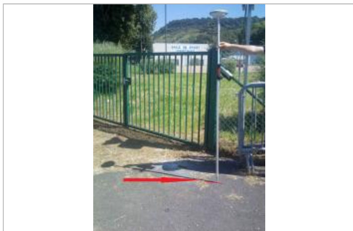
Laisse de crue sur la chaussée.

Altitude calculée de l'eau (en m) : 5.13