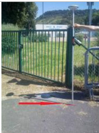
Laisse de crue sur la chaussée.