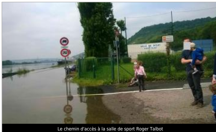
Le chemin d'accès à la salle de sport Roger Talbot