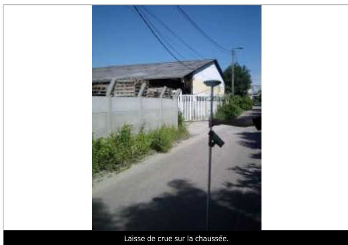
Laisse de crue sur la chaussée.

Altitude calculée de l'eau (en m) : 5.12 m