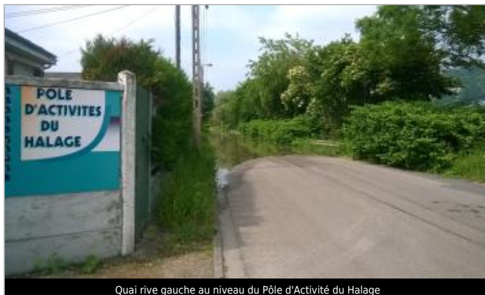
Quai rive gauche au niveau du Pôle d'Activité du Halage