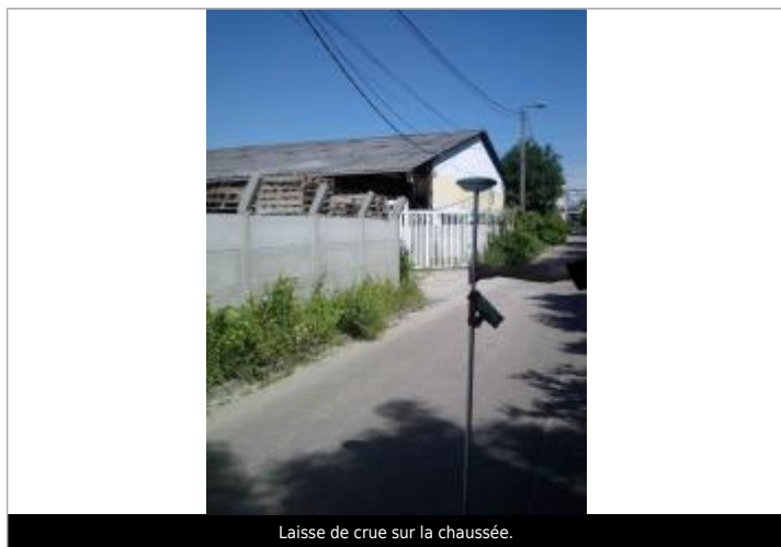
Laisse de crue sur la chaussée.