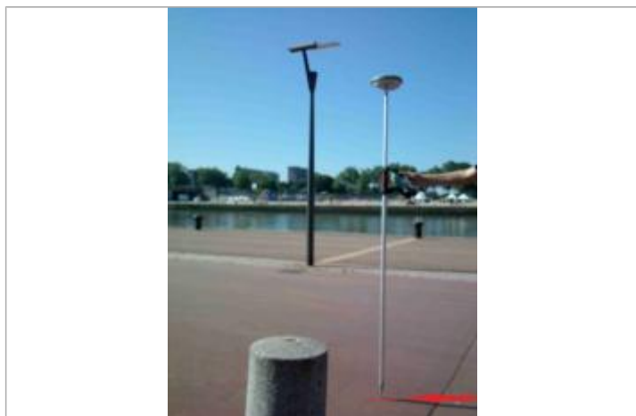
Quai rive droite entre les hangars A et B

Altitude calculée de l'eau (en m) : 4.95 m