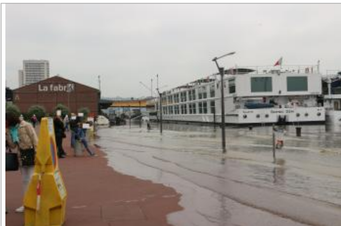
Quai rive droite entre les hangars A et B