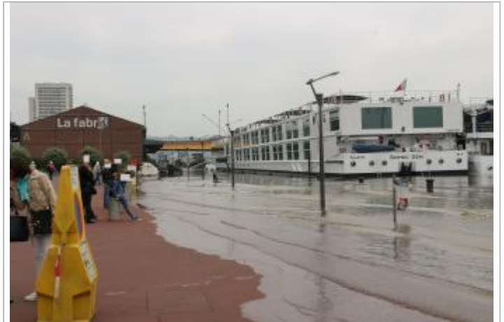
Quai rive droite entre les hangars A et B