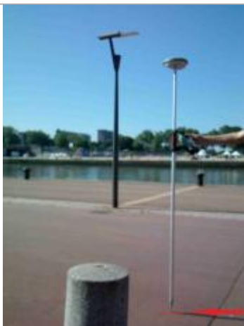
Quai rive droite entre les hangars A et B

Altitude calculée de l'eau (en m) : 4.95 m