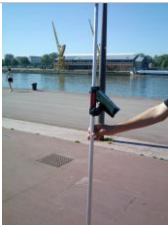
Quai rive droite entre les hangars C et D