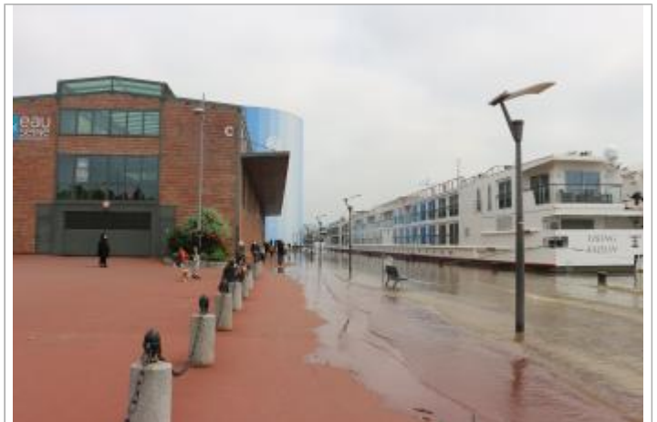
Quai rive droite entre les hangars C et D

Coordonnées WGS84 : X: 1.07485800 / Y: 49.44268800