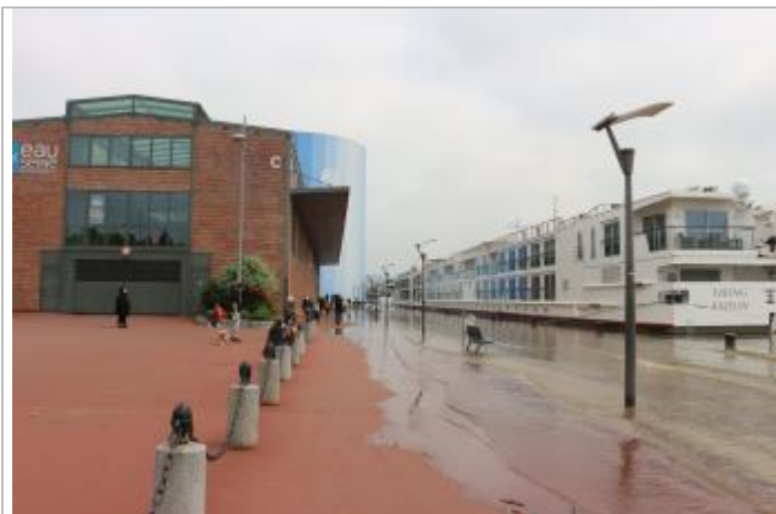
Quai rive droite entre les hangars C et D

Coordonnées WGS84 : X: 1.07485800 / Y: 49.44268800