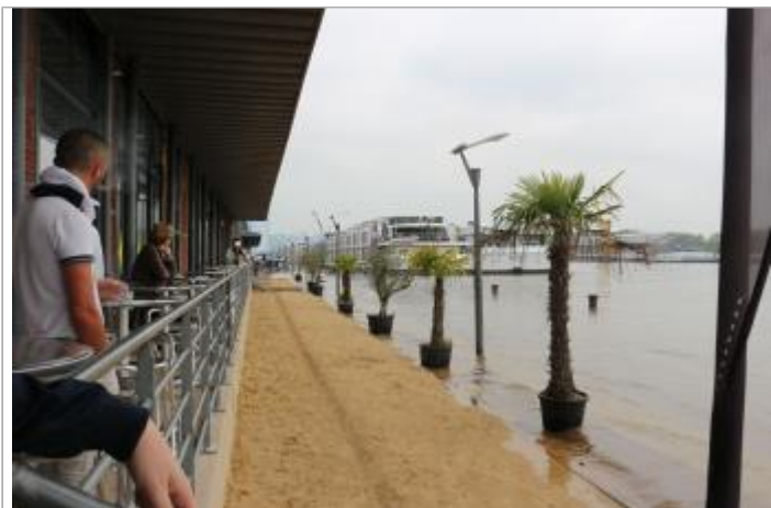
Quai rive droite devant le hangar E