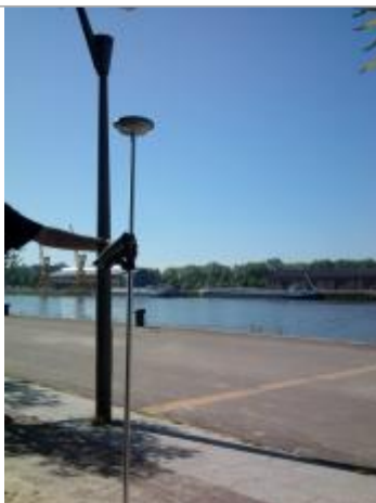
Laisse d'inondation devant le hangar E

Altitude calculée de l'eau (en m) : 5.03