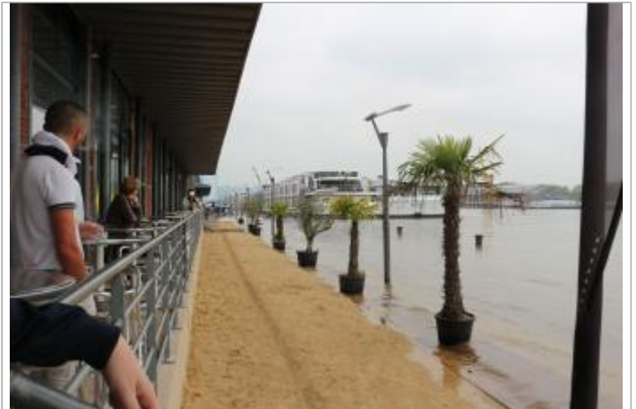
Quai rive droite devant le hangar E

Coordonnées WGS84 : X: 1.07247600 / Y: 49.44336300