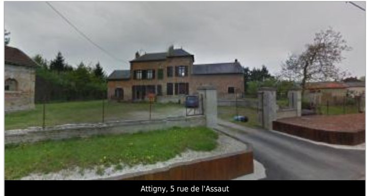
Attigny, 5 rue de l'Assaut