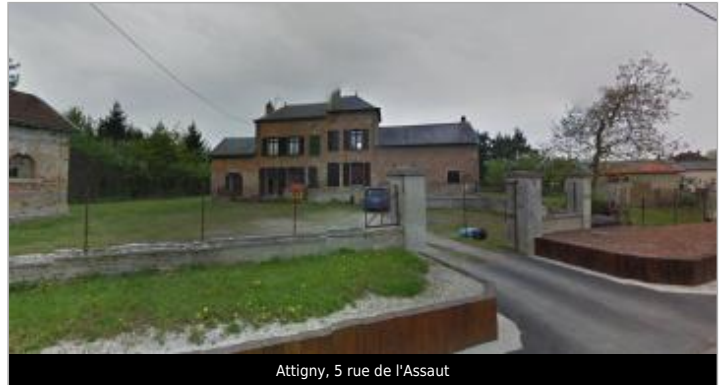
Attigny, 5 rue de l'Assaut