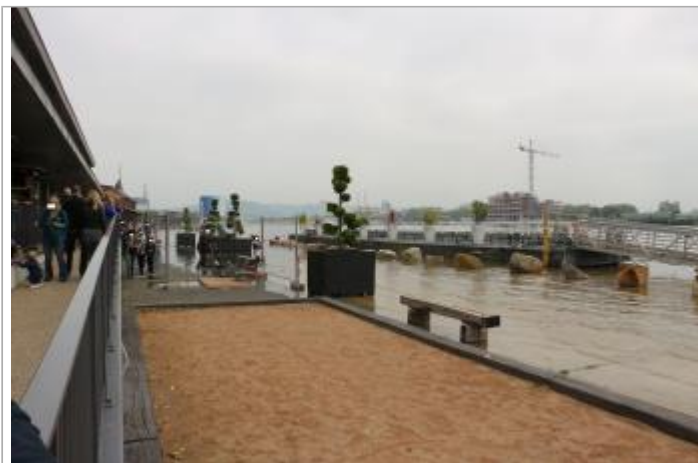
Quai rive droite à l'angle du hangar E