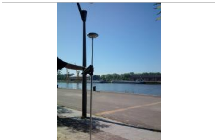
Quai rive droite à l'angle du hangar E.

Altitude calculée de l'eau (en m) : 4.92 m