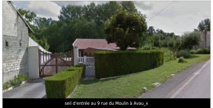
seil d'entrée au 9 rue du Moulin à Avau_x