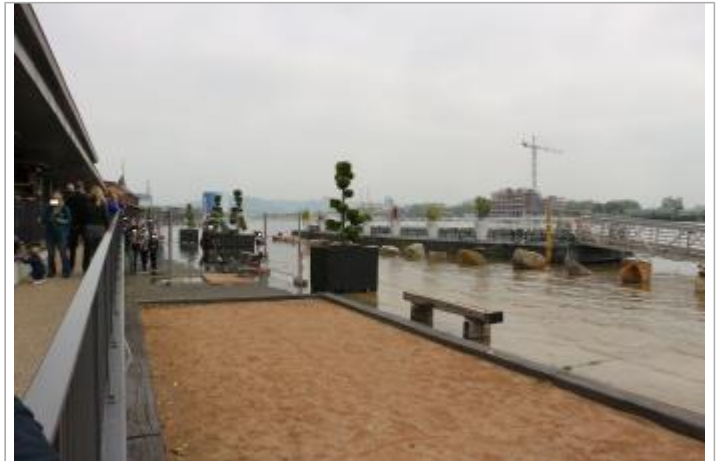
Quai rive droite à l'angle du hangar E

Coordonnées WGS84 : X: 1.07215400 / Y: 49.44347000