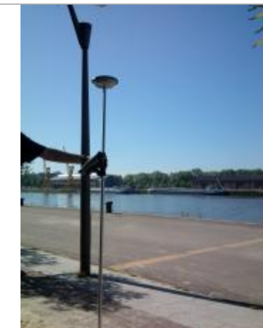
Quai rive droite à l'angle du hangar E.

Altitude calculée de l'eau (en m) : 4.92