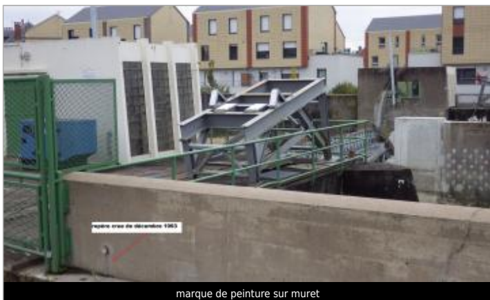
repère crue de décembre 1993