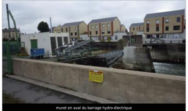
muret en aval du barrage hydro-électrique