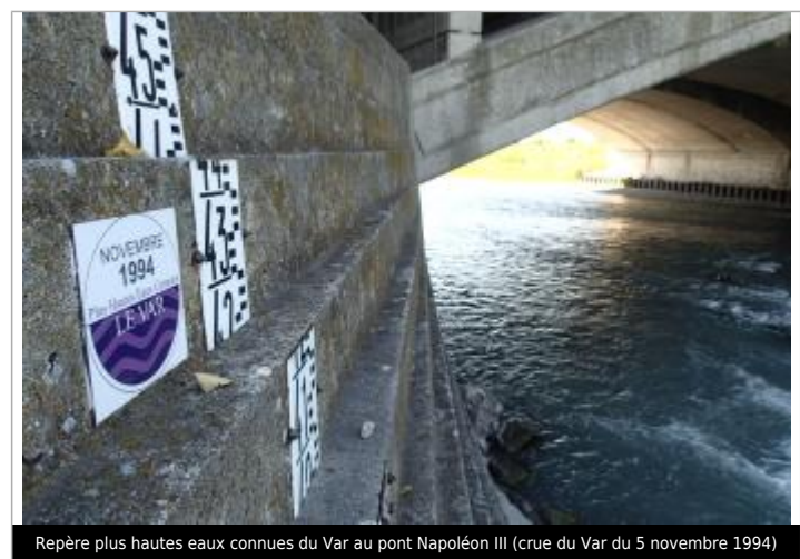
Repère plus hautes eaux connues du Var au pont Napoléon III (crue du Var du 5 novembre 1994)