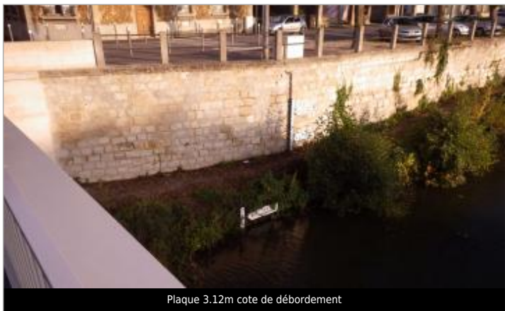
Plaque 3.12m cote de débordement