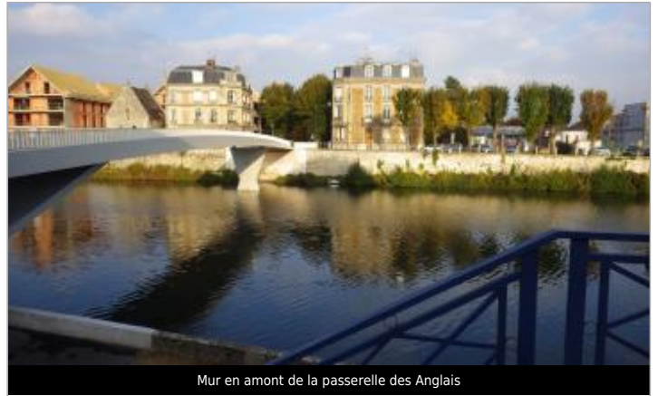
Mur en amont de la passerelle des Anglais