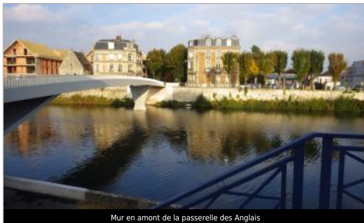
Mur en amont de la passerelle des Anglais