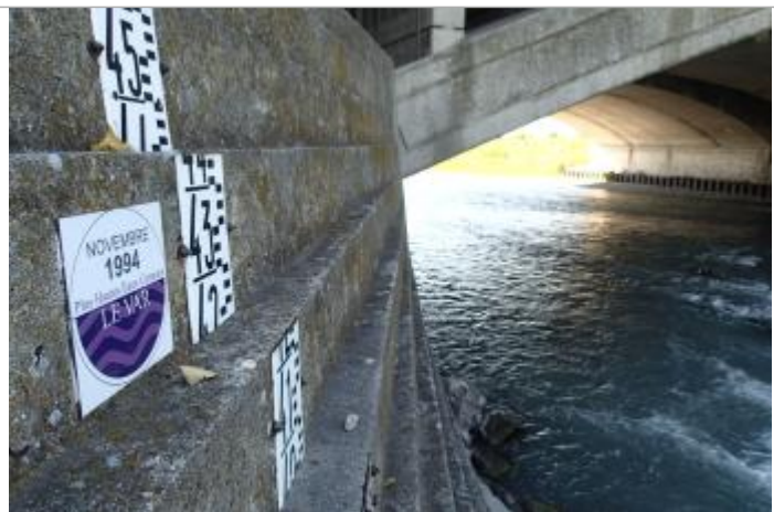
Repère plus hautes eaux connues du Var au pont Napoléon III (crue du Var du 5 novembre 1994)