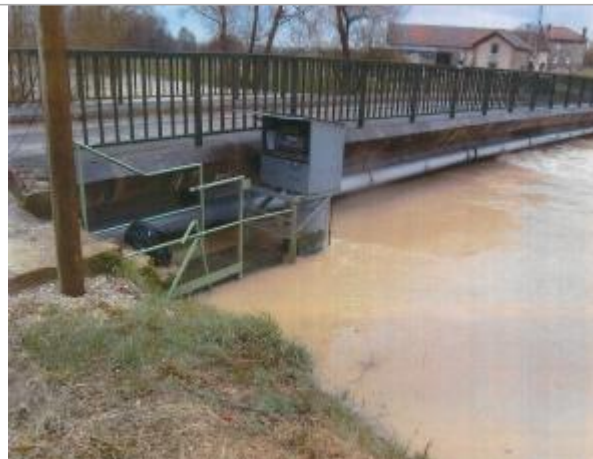
Station de Chevières, rive droite, aval du pont