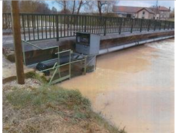
Station de Chevières, rive droite, aval du pont