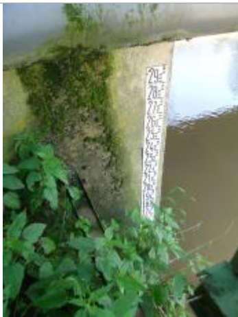
échelle de crues sur pile aval du pont