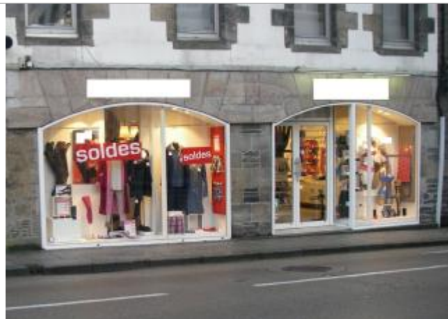
Magasin 40 place des Otages