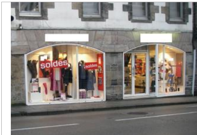
Magasin 40 place des Otages - Photographie DHE 2015