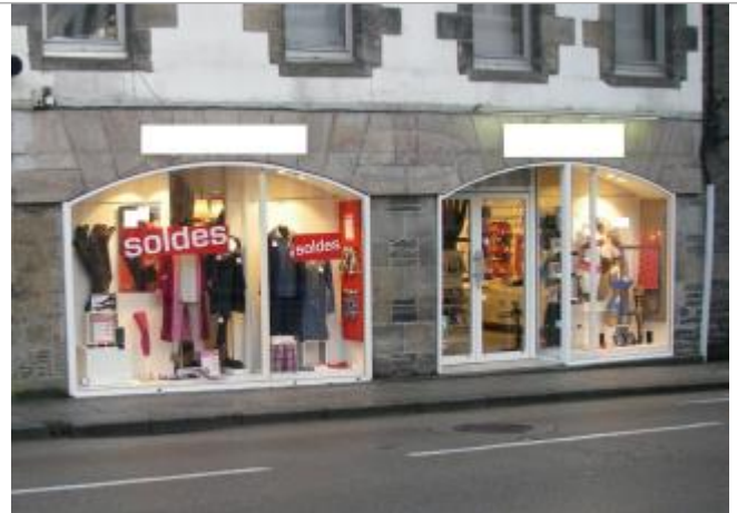
Magasin 40 place des Otages