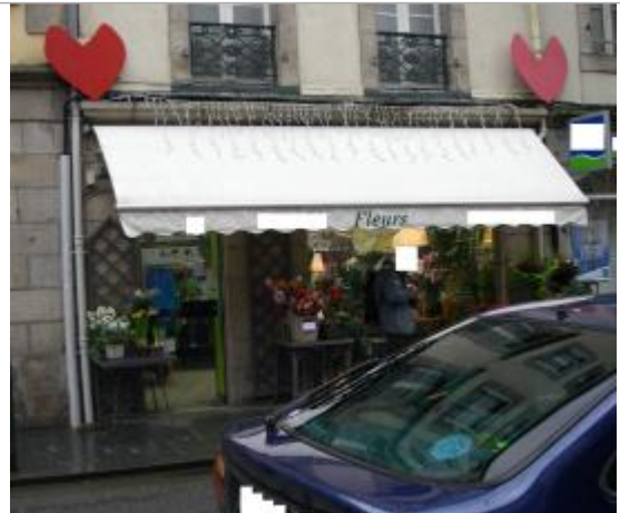
Magasin situé 3 rue de Brest - photographie DHE 2015