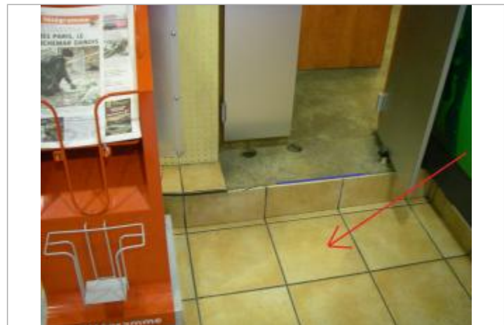
Plancher du rez-de-chaussée au droit de la marche du bar.

GÉNÉRAL Code : DHE_29151-007-007b Date de mise à jour : 04/05/2020 Auteur : SPC VCB