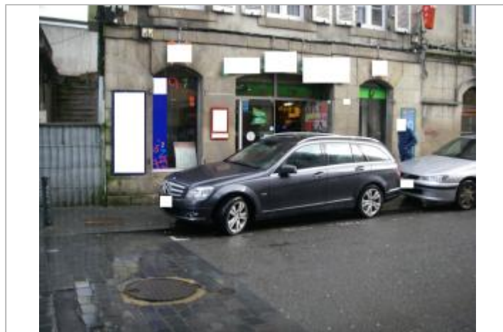
Magasin 20 rue de Brest - Photographie DHE 2015

GÉOLOCALISATION Coordonnées WGS84 : X: -3.82851750 / Y: 48.57620200 Coordonnées RGF93 (Lambert 93) X: 196897.78 / Y: 6852432.44 Coordonnées RGF93 (ETRS89) : X: -3.8285175 / Y: 48.576202 Code Hydro: J2614000 Rive de référence: Gauche