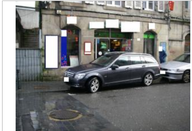
Magasin 20 rue de Brest