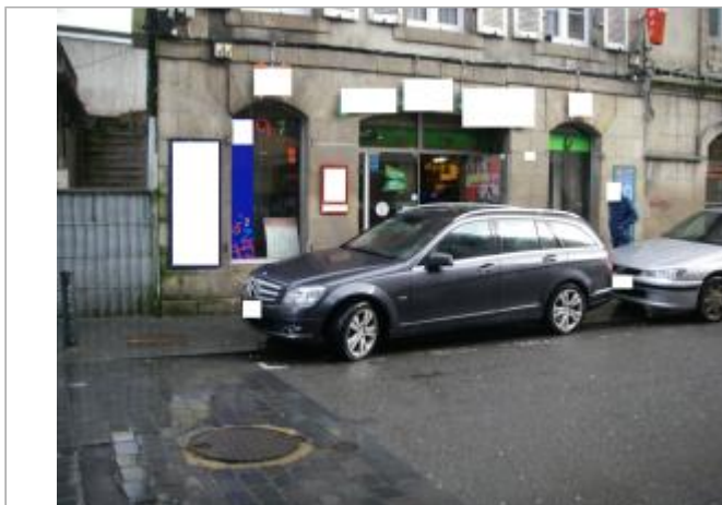
Magasin 20 rue de Brest