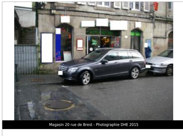
Magasin 20 rue de Brest