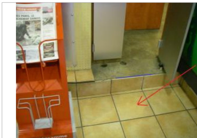
Plancher du rez-de-chaussée au droit de la marche du bar.