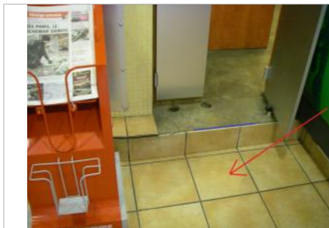
Plancher du rez-de-chaussée au droit de la marche du bar.