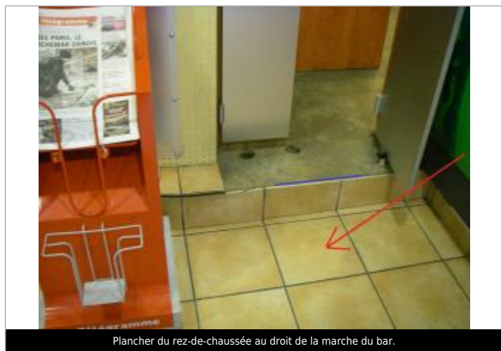
Plancher du rez-de-chaussée au droit de la marche du bar.

Code : DHE_29151-007-007b Date de mise à jour : 04/05/2020 Auteur : SPC VCB