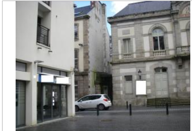
Magasin 28 rue de Brest - Photographie DHE 2015

Coordonnées WGS84 : X: -3.82901890 / Y: 48.57569000