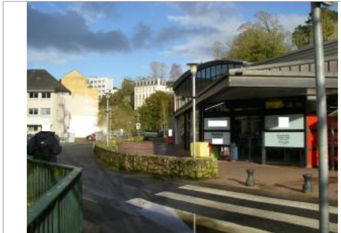
Bâtiment supermarché en rive droite rue de Brest

Coordonnées WGS84 : X: -3.82942600 / Y: 48.57493700