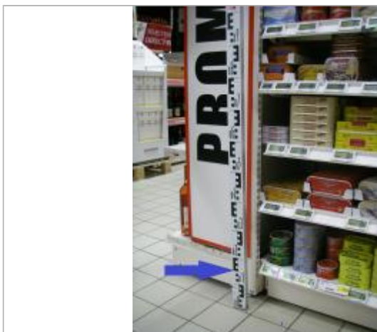
Plancher du magasin au droit d'une gondole

Altitude calculée de l'eau (en m) : 8.66 m