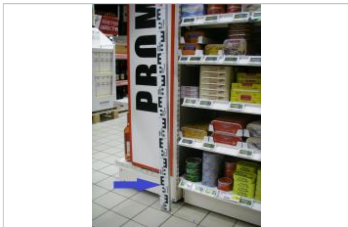
Plancher du magasin au droit d'une gondole

Méthode : Nivellement direct Organisme : Géomètre (cabinet) Référence nivelée : Autre type de référence Description référence du repère : Plancher du magasin au droit d'une gondole Système altimétrique : NGF IGN 1969 (système normal) Altitude de la référence (en m) : 8.510 m Différence entre le niveau d'eau et la référence (en m) : 0.150 m Altitude calculée de l'eau (en m) : 8.66