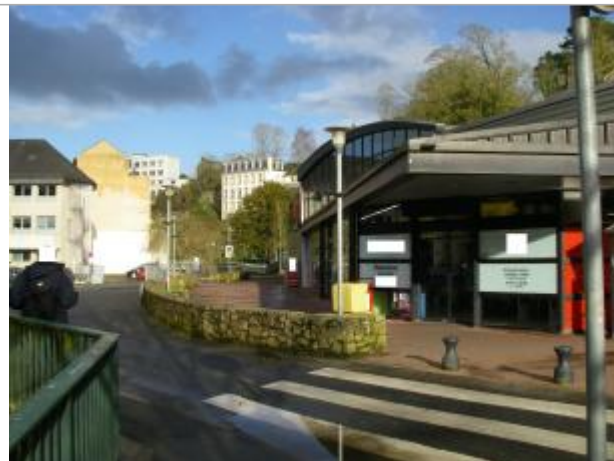
Bâtiment supermarché en rive droite rue de Brest