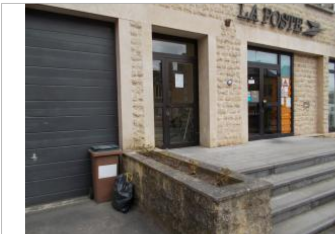
Vue d'ensemble du repère sur la façade du bâtiment La Poste