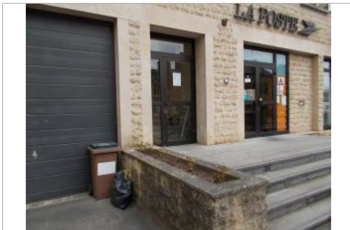
Vue d'ensemble du repère sur la façade du bâtiment La Poste