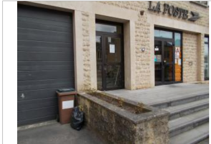
Vue d'ensemble du repère sur la façade du bâtiment La Poste