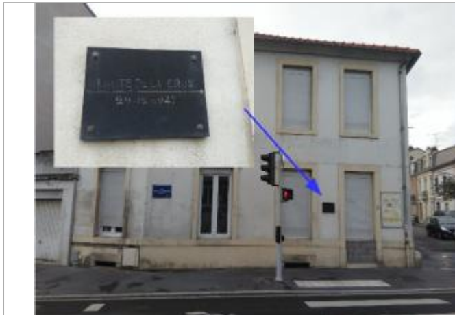
Repère de la crue de référence 1947 Rue Charles de Foucauld