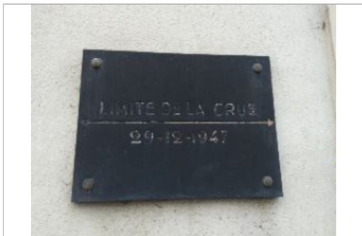
Zoom sur le repère