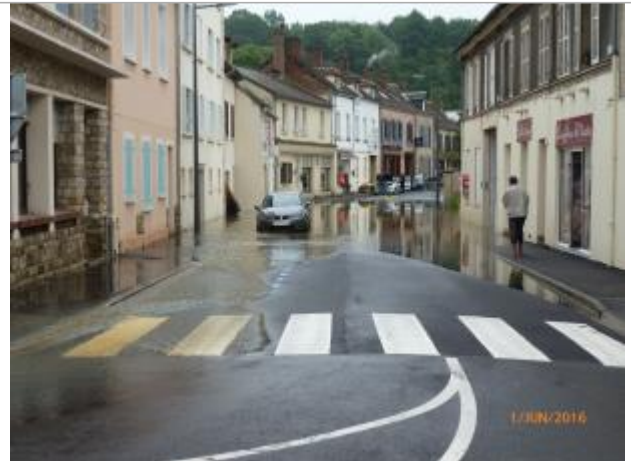
Vue d'ensemble de la rue du Grand Pont