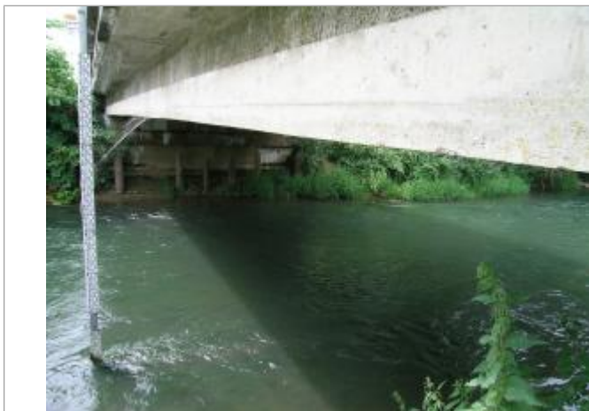
Echelle de crues de Mortiers