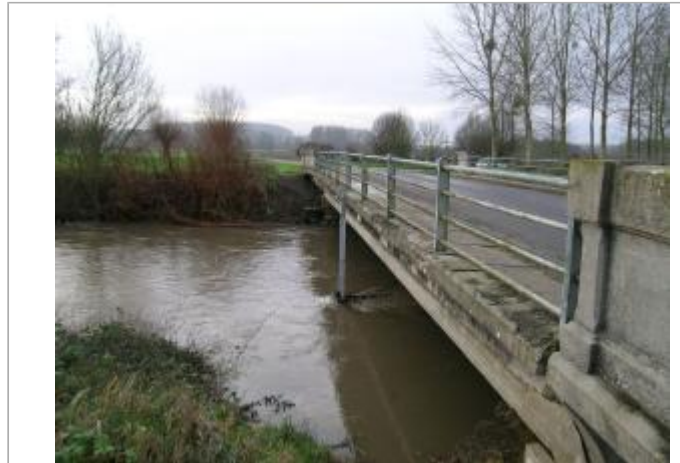
Pont sur la Serre