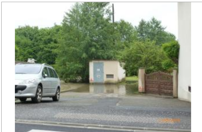
A l'aval de la rue du Grand Pont