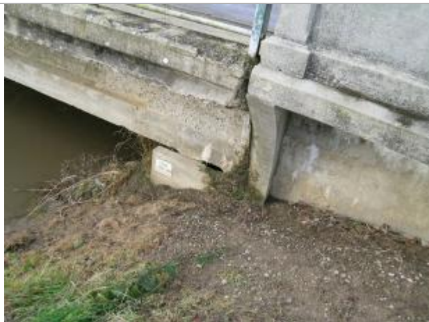
Plaque 13 décembre 1966 pile aval du pont en rive gauche