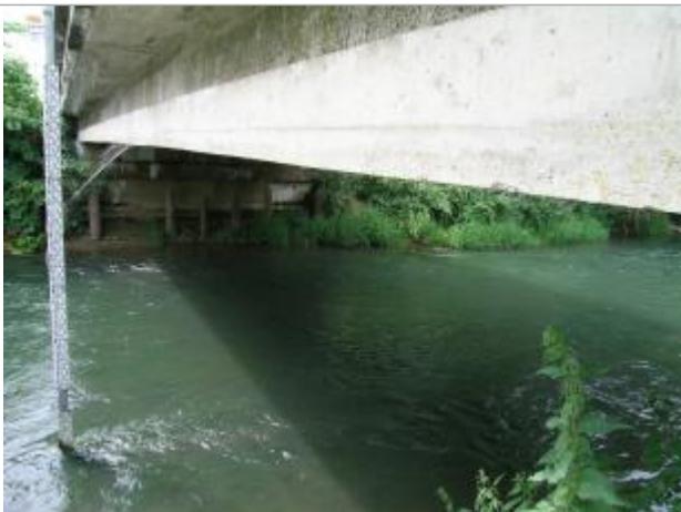
Echelle de crues de Mortiers