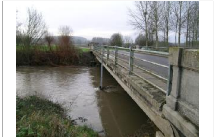
Pont sur la Serre