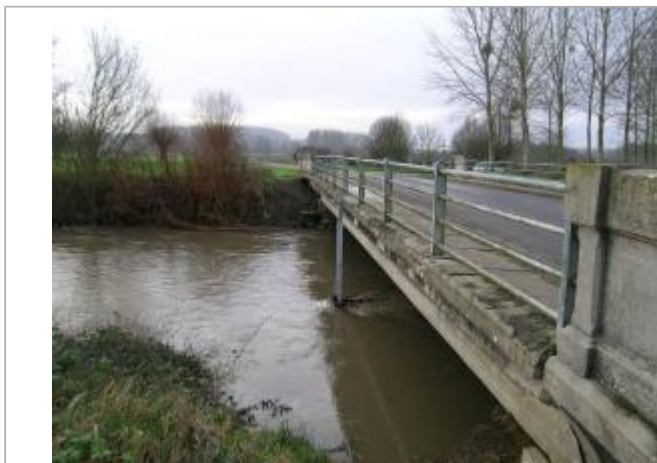
Pont sur la Serre