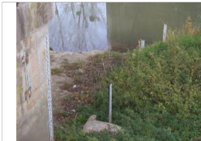
Echelle de Givry

COTE DE LA CRUE DU 22/12/1993 : 5.09 M À L'ÉCHELLE SOIT 80.69 M NGF - 18/10/2016