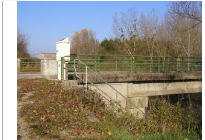
station de Givry en amont du pont de la RD 43