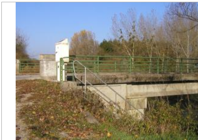
station de Givry en amont du pont de la RD 43