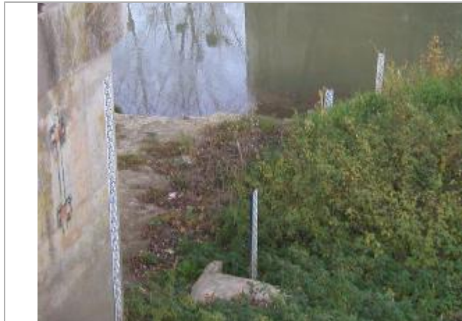
Echelle de Givry

COTE DE LA CRUE DU 22/12/1993 : 5.09 M À L'ÉCHELLE SOIT 80.69 M NGF - 18/10/2016