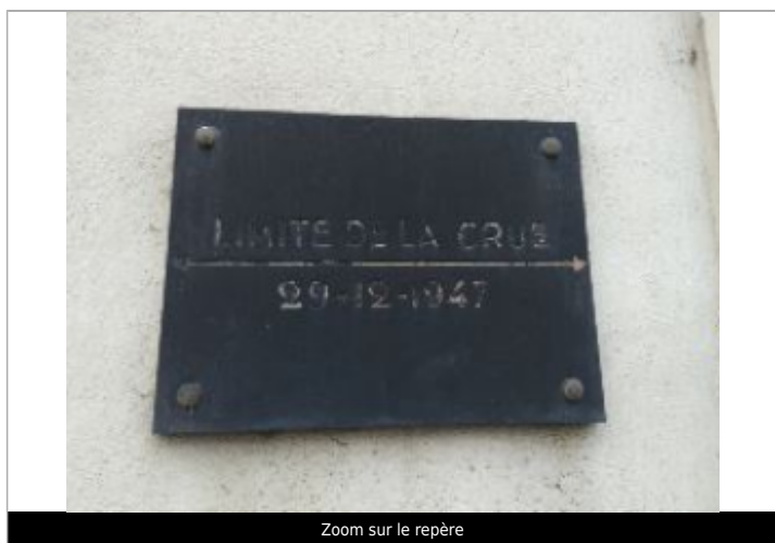
Zoom sur le repère