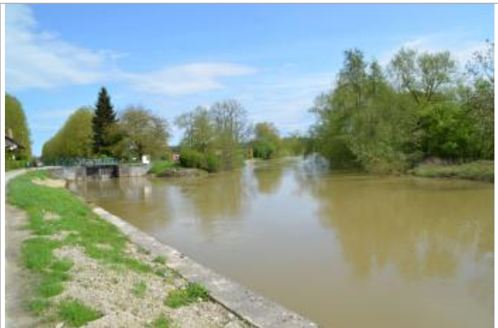
Station de Vouziers

GÉOLOCALISATION Coordonnées WGS84 : X: 4.70360790 / Y: 49.40399600 Coordonnées RGF93 (Lambert 93) X: 823676.93 / Y: 6924058.18 Coordonnées RGF93 (ETRS89) : X: 4.7036079 / Y: 49.403996 Code Hydro: H1--0200 Rive de référence: Gauche