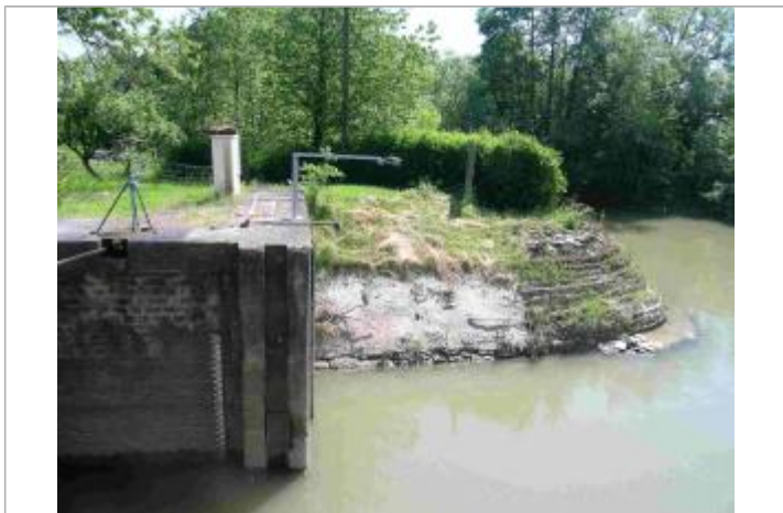
échelle sur le mur de l'écluse

MARQUE Texte : 4,37 m (échelle cassée à 4,10 m)