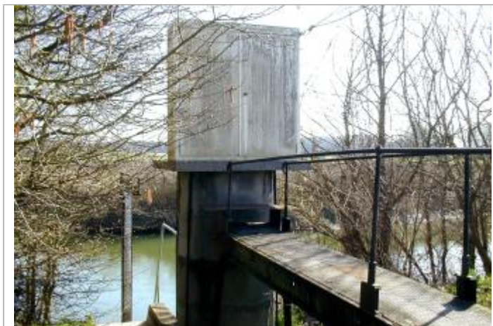
Echelle de crue de Sempigny: chemin de halage du canal latéral à l'Oise