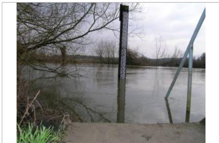
crue du 25 décembre 1993

CRUE DU 25 DÉCEMBRE 1993 : 38,68 M - 25/12/1993