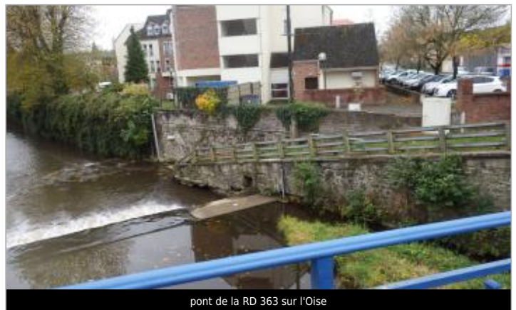
pont de la RD 363 sur l'Oise