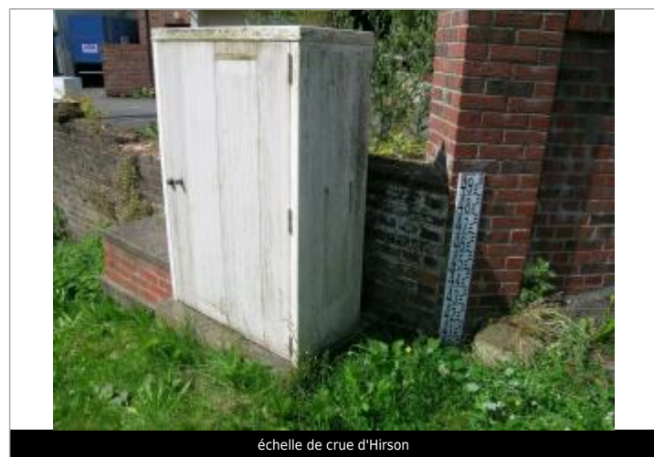
échelle de crue d'Hirson