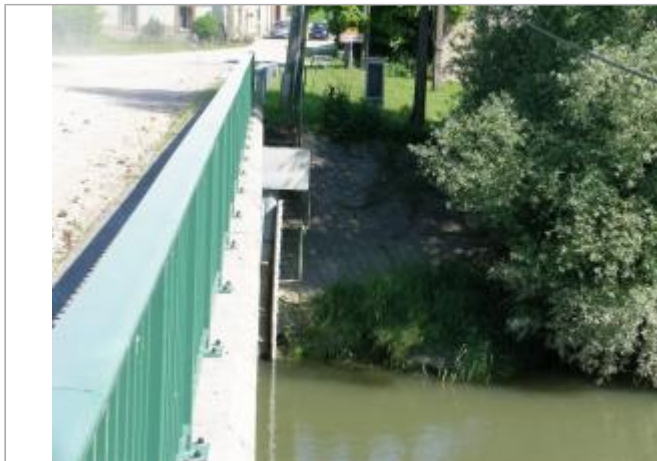
echelle de crue de Mouron