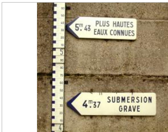
Plaque de la crue de 1882