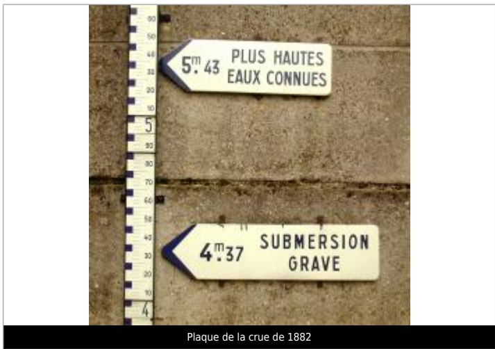
Plaque de la crue de 1882