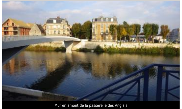
Mur en amont de la passerelle des Anglais