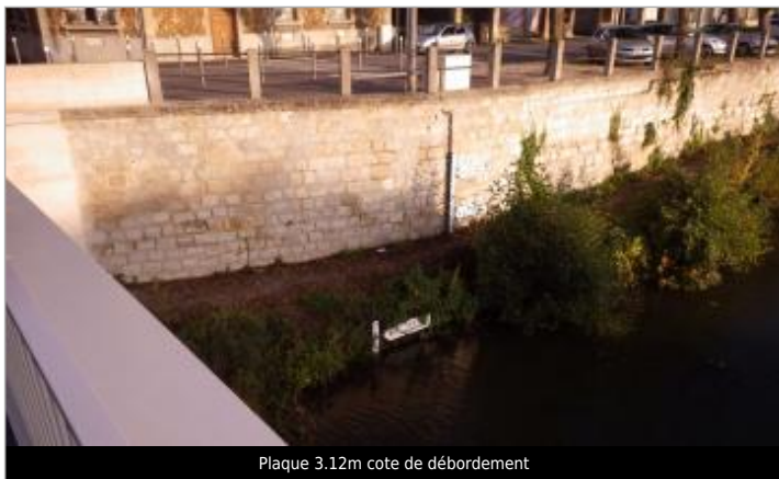
Plaque 3.12m cote de débordement