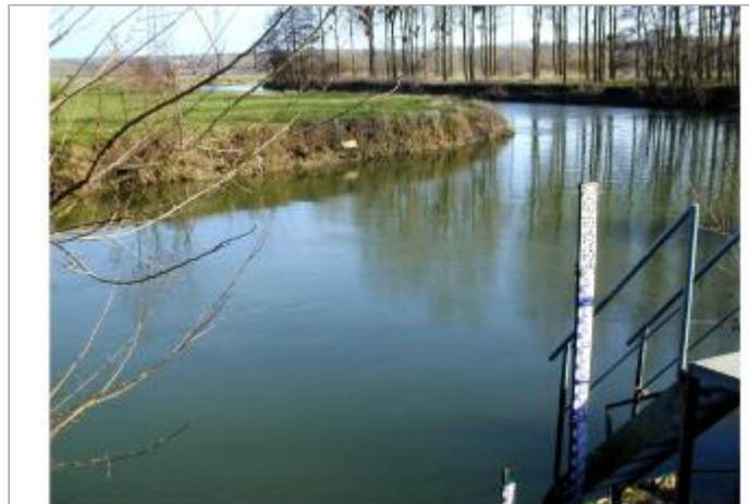
station de Condren

Coordonnées RGF93 (ETRS89) : X: 3.2809118 / Y: 49.6250028