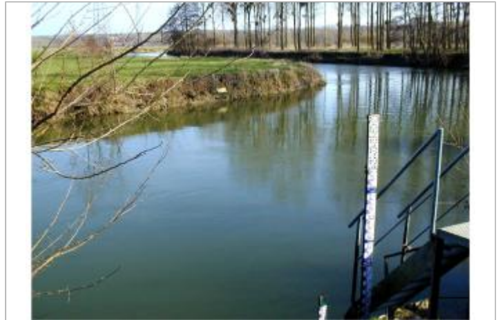
station de Condren