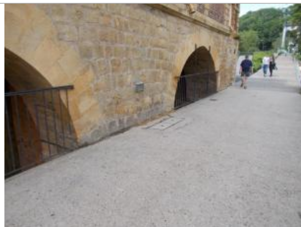
Localisation du repère