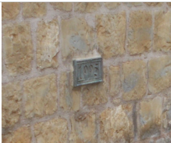
Zoom sur le repère