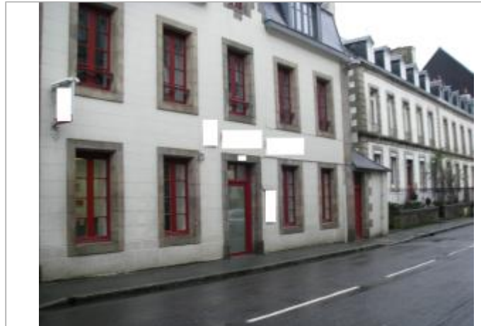
Bâtiment, 47 rue de Brest - Photographie DHE 2015

Coordonnées WGS84 : X: -3.83032330 / Y: 48.57514500