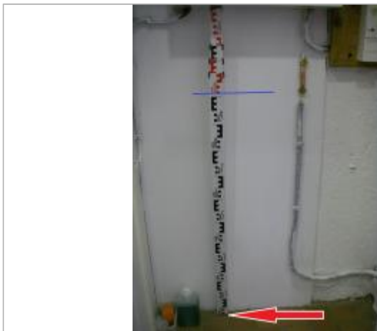
Crue du 06 février 2014 (hauteur depuis le plancher)

Texte : Niveau matérialisé à l'intérieur du bâtiment: un trait au crayon sous le tableau électrique