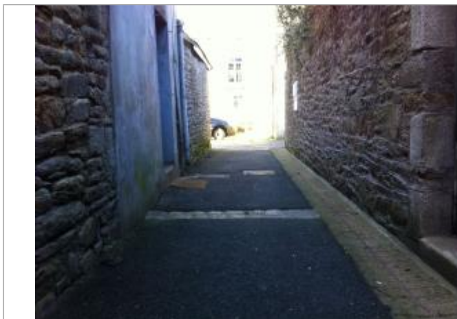
Ruelle de l'Isole, arrière du bâtiment n°3 en rive gauche