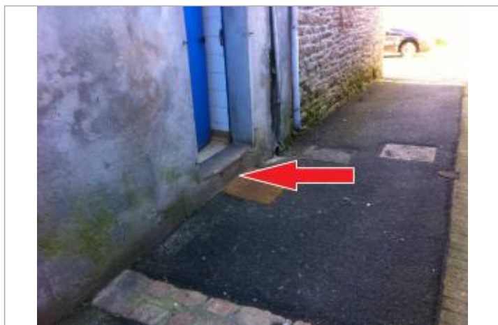
Limite au sol au pied de la porte, déduite d'une photographie pendant la crue.