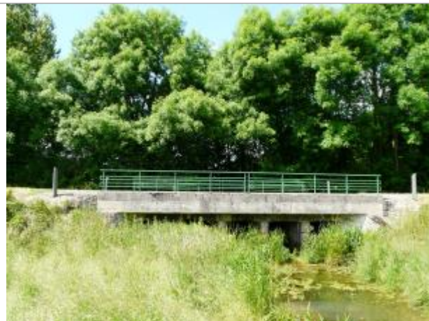
vue latérale de l'ouvrage coté amont