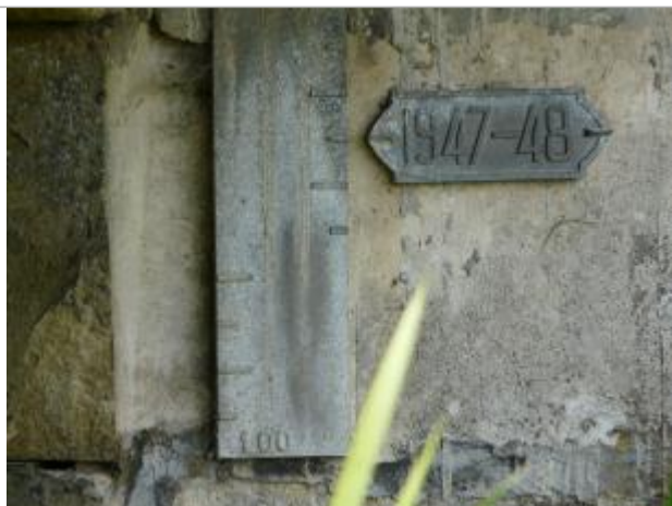
plaque indiquant la hauteur d'eau sur l'échelle de crue

REPÈRE NIVELÉ PAR GINGER ENVIRONNEMENT LORS DE A RÉALISATION DE L'ATLAS DES ZONES INONDABLES SELON LA MÉTHODE HGM - 22/06/2010