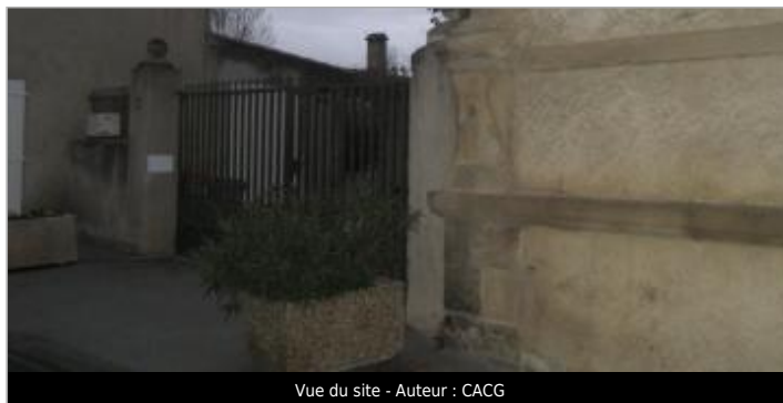
Vue du site - Auteur : CACG