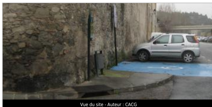
Vue du site - Auteur : CACG