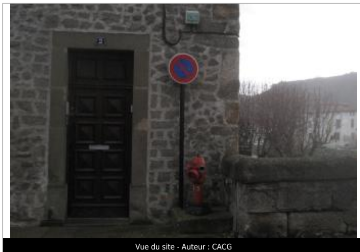
Vue du site - Auteur : CACG